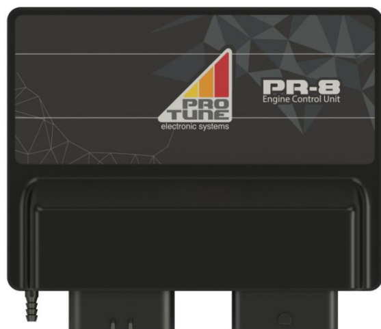
Figura 1: ECU PR-8